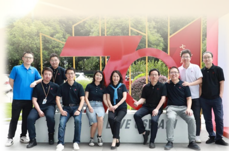
高性能大跨度空间结构工作室核心成员