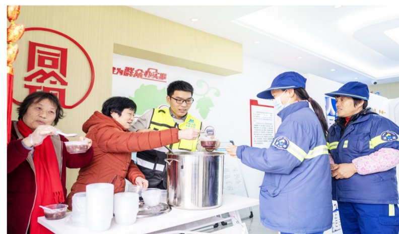
近日,中建八局上海市域铁路嘉闵线3标项目引入所在地马陆镇特色暖心工程,专门开设“小马驿站”特色服务窗口,为户外劳动者提供休息场所,并定期举办各类活动,送一杯热粥、营养早餐等,打造为民服务前台。(张真正)