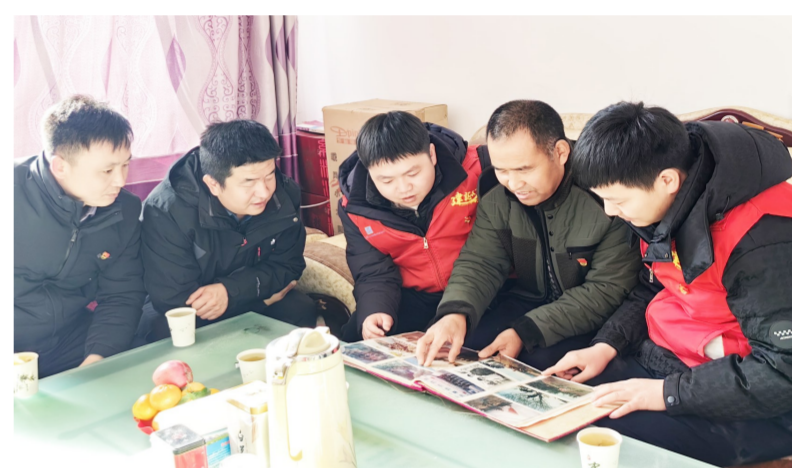
近日,中建二局三公司兰州新区城市智慧能源岛协同耦合项目党员前往康乐县魏家寨村组织开展慰问老兵活动,向投身军旅、多次深入前线的老兵送去慰问品表达敬意,激励全体党员为建设美丽中国贡献自己的力量。(常捷)