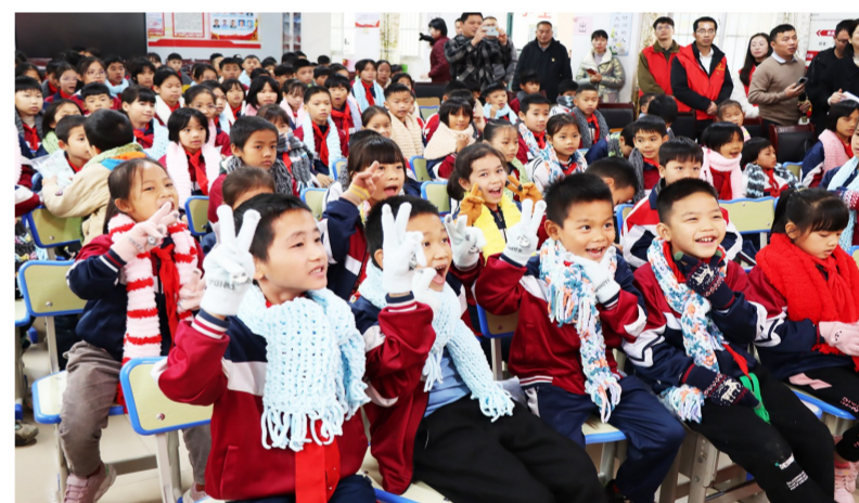
近日,中建七局六公司联合南宁市妇联前往南宁市新福镇飞龙小学开展“暖冬行动”送温暖活动,为留守儿童、少数民族学生送上300余条亲手编织的围巾以及手套、篮球等物资,让他们感受到冬日的暖心关怀。(黄凯迪、王长远)