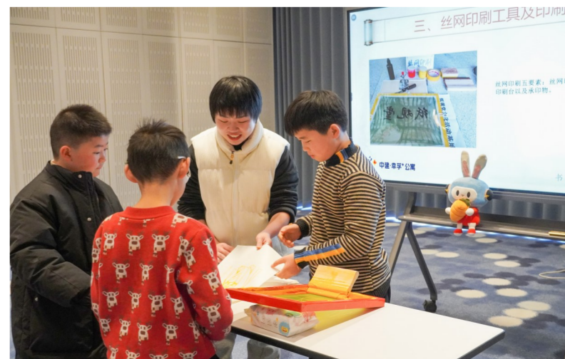
1月22日,上海市首个“新时代城市建设者管理者子女爱心寒托班”在中建·幸亭+公寓松江店正式开班,将助力缓解城市建设者管理者子女寒假“看护难”问题,主要面向城市建设者、外卖骑手、快递员、网约车司机等新业态青年群体子女。(周雨茜、高翔)