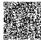
扫码观看视频报道