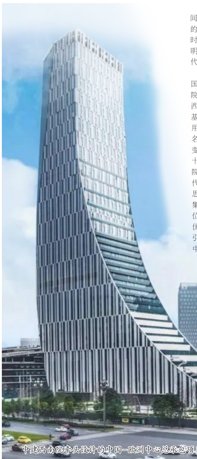
中建西南院牵头设计的中国-欧洲中心总承包项目

建筑,生存的空间、凝固的音乐、石头的史书,把无与伦比的时空想象融进人类文明演进的悠远史诗,代代传承、生生不息。自诞生之日起,中国建筑西南设计研究院有限公司(简称中建西南院)始终传承红色基因、秉持家国情怀,用设计践行“以建筑之名、为时代立传”的不变初心。特别是党的十八大以来,中建西南院坚持以习近平新时代中国特色社会主义思想为指引,紧紧围绕集团对设计业务的定位要求,充分发挥技术优势、人才优势和前端引领带动作用,不断为中建集团“四位一体”创造新模式、赋予新内涵,为人民美好生活