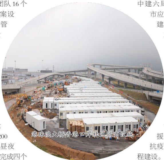
珠琅澳尖桥香港口岸社区隔离设施

疫情面前,中建广大党员不怕艰险、冲锋在前,充分发挥党员先锋模范作用和基层党组织坚强堡垒作用,数以万计共产党员在大战大考中淬炼坚强党性,用实际行动践行初心使命。