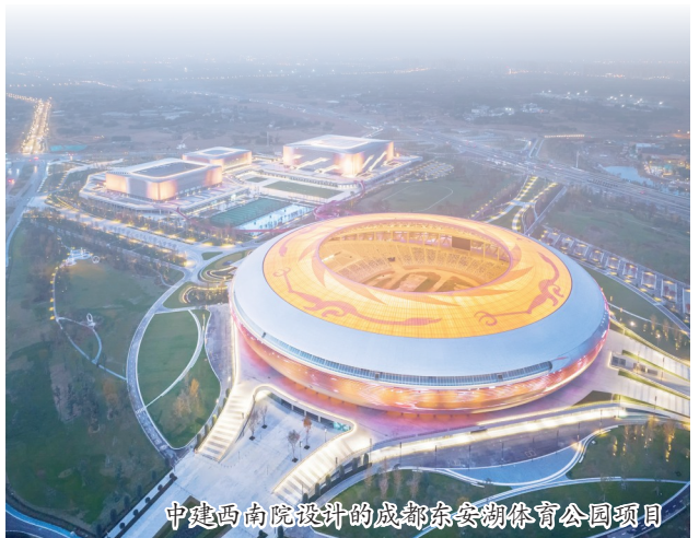
中建西南院设计的成都东安湖体育公园项目

科技造梦 创新引领未来 佳绩频传的背后,是“中国建造”的硬核科技密码。从世界上首个大跨度椭圆形索承单层网壳结构的常州体育会展中心体育馆,到西部地区首个投入使用的“光储直柔”办公建筑中建滨湖设计总部,再到世界最高水平的自清洁辐射制冷涂料……经过多年探索和投入,中建西南院聚焦绿色建造、智慧建造、建筑工业化等热点技术研发方向,在大跨度空间结构、建筑减震抗震、建筑环境与节能、新技术及新材料创新孵化等多个领域形成了领先的科研和技术优势。 近年来,中建西南院先后荣获省部级以上科技进步奖100余项,其中国家科技进步奖一等奖2项、二等奖3项;获得国家发明、实用新型及外观设计专利250余项;主编国家、行业及地方标准110余项,企业科技创新创效成果在全国建筑设计企业中处于领先地位。 依托科研优势,中建西南院积极打造产学研用一体化科技创新体系,推动科技成果转化,带动市场开拓,目前已在绿色墙材、环保涂料、节能设备、智慧城市等4大方面取得突破,形成9大类别的专利产品。 聚焦数字经济,中建西南院全力打造“数字设计院”,依托工信部大型BIM设计施工软件研发项目和中建集团“136工程”,自主研发的国产自主知识产权结构设计软件EasyBIM-s成功入选住建部典型案例,为解决