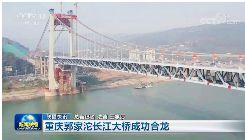
重庆郭家沱长江大桥成功合龙

日前,项目已完成总工程量的90%,预计今年10月具备通车条件。届时,重庆中心城区南北向交通压力将得到有效缓解。