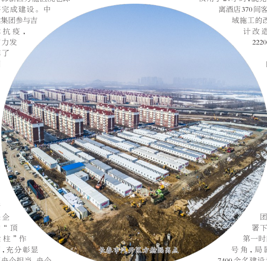
长春市汽开区方舱隔离点