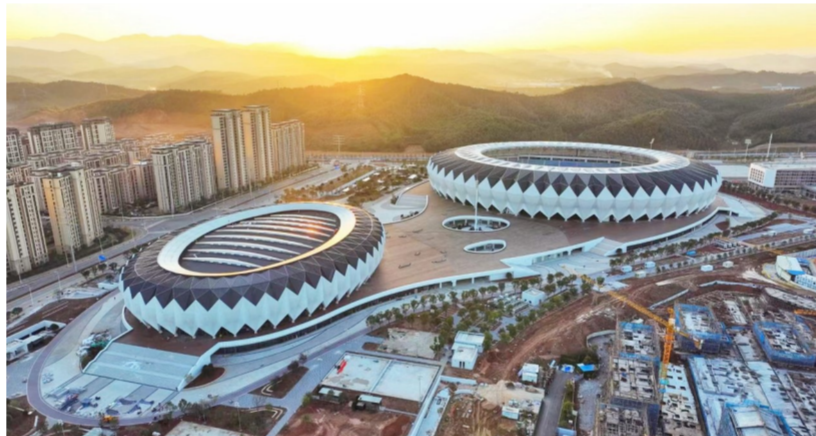
近日,中建海峡承建的福建省南平市武夷新区体育中心项目竣工。该项目是福建省重点项目,总建筑面积约16.59万平方米,由体育场、综合体育馆及配套用房A、B组成。建筑造型运用“武夷茶花”构思,投用后可承办综合体育赛事,也可用于市民健身运动、会展、培训、大型文艺演出等。(柒轩)

项目团队践行新发展理念,将5G技术充分应用到“BIM+智慧工地”管理平台,通过平台实现数据汇总和提取,得出合格率,并综合对比情况,为项目整体的