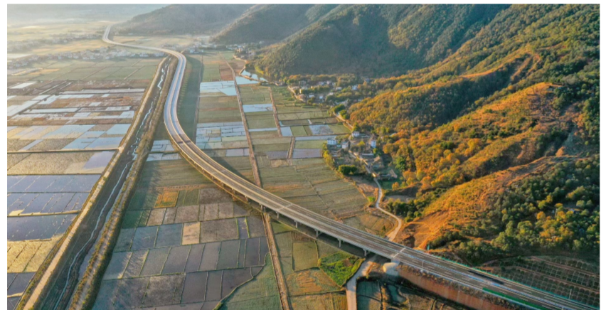
12月28日,由中建基础牵头,中建一局、中建三局、中建四局、中建六局、中建七局共同参建的华丽高速仁和至永胜段顺利实现试通车。此次通车路段主线全长32千米,共24座桥梁,4条隧道。通车后,沿线永北镇至仁和镇的通车时间将由原来的2个多小时缩短至30分钟。(陈辉)