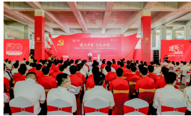
中建科工深圳龙岗坪地高中园项目宣讲现场