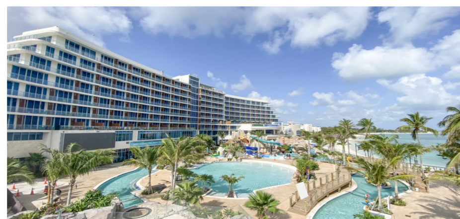
动文化建设、带动当地旅游业以及未来经济发展产生深远影响。

明尼斯总理表示,新地标项目是巴哈马首都拿骚市中心振兴计划的引领工程之一,也是向世界展示巴哈马风采的“城市名片”。项目必将对创造就业岗位、推