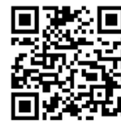
扫码关注更多宣讲资讯

中建集团将继续发扬光荣传统,赓续红色血脉,弘扬伟大建党精神,积极投身到进行伟大斗争、建设伟大工程、推进伟大事业、实现伟大梦想的实践当中,深刻把握“九个必须”,加快实现“一创五强”战略目标,为实现第二个百年奋斗目标、实现中华民族伟大复兴而不懈奋斗!