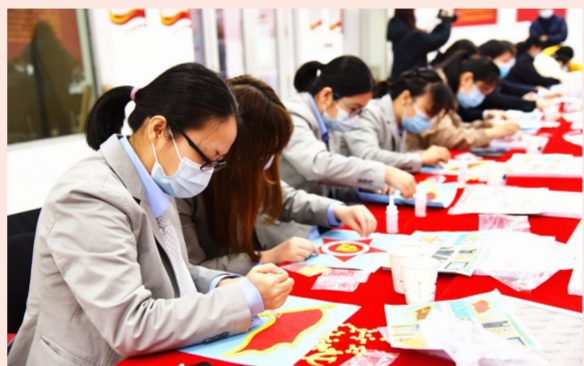
3月8日,中建一局五公司组织开展“巾帼不让须眉,奋进建党百年”主题活动。女职工们用一粒粒纽扣绘制党旗和党徽。(高增亮)