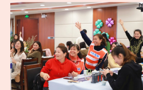
3月8日,中建四局EPC设计院开展“巾帼心向党”油画创作活动,邀请资深老师指导,女职工们度过了一个充实的节日。(黄思予)