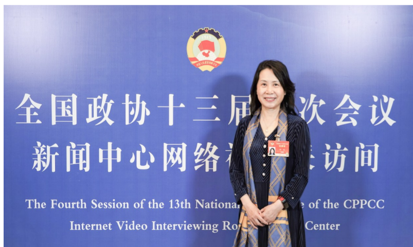
冯远 全国政协委员 中建西南院总工程师

改革开放以来,我国各大中城市公共场所的无障碍设施逐渐增多,但我们也应看到,无障碍环境建设标准不高、系统不够、设施不均衡、管理不到位的现象依然存在,与国际一流水平相比还存在差距。