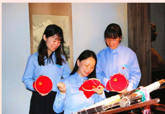
3月4日,中建二局一公司女职工们走进湖南湘绣博物馆,20多名女职工化身“绣娘”,在老师的指点下绣制党旗,一针一线绣出爱党情。(刘芳)