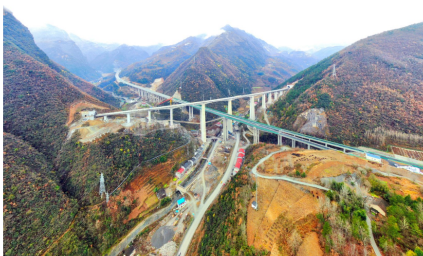
近日,中建七局土木工程公司参建的湖北保神高速全线贯通,标志着湖北实现“县县通高速”目标,将进一步密切襄阳和神农架林区联系。(李亚飞)