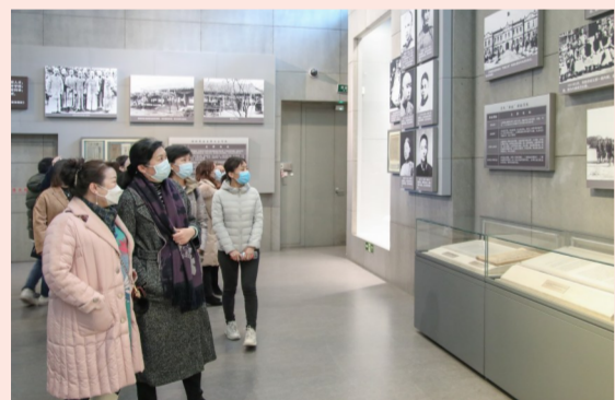
3月5日,集团总部女职工在国家博物馆参观“复兴之路”“月球样品001号”等主题展览,女职工学习党史,传承红色基因,展示巾帼力量。(姜楠)