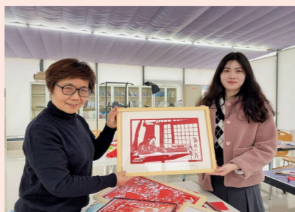
3月8日,中建安装上海公司女职工通过剪纸还原党史中的重要事件,感受非遗文化,弘扬和传承革命精神。(丁媛媛)