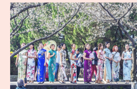
3月4日,中建三局总承包公司参加“两山”医院建设的铁娘子,脱下工装、换上旗袍,赏樱花、拍写真,用特有方式庆祝三八劳动妇女节。(吴渊)