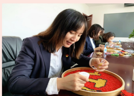
3月8日,中建科工湖北公司开展女职工手工活动,用画作、拼贴等作品表达对建党百年的庆祝与祝福。(董亚超)