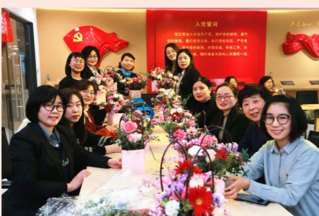
3月5日,中建交通天津公司开展“巾帼心向党 百年正辉煌”活动,女职工们重温党的伟大历程,并创作插花作品。(李敏)