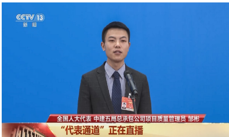
邹彬 全国人大代表 中建五局总承包公司质量管理员

我建议加快推动“农民工”向新型建筑产业工人转型。我特别想对更多的农民工兄弟姐妹们说:一定坚持干一行、爱一行,成长为大国工匠,为实现“中国梦”贡献自己的一份力量。