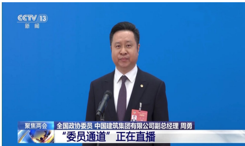
周勇 全国政协委员 中建集团党组成员、副总经理

“十三五”期间,中央企业高质量建设“一带一路”沿线项目超过3400个,打造了一大批标志性工程,有力促进了当地经济社会发展。未来,我们将践行新发展理念,打造更多精品工程、幸福工程、民心工程,让“一带一路”建设更好造福各国人民。