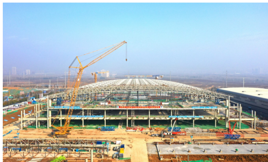
3月1日,中建二局华东公司承建的合肥滨湖国际会展中心二期项目封顶,其144米的屋盖桁架跨度创下全国之最。(余小敏)

近日,中建港航局承建的蒲川生物医药产业园基础设施建设项目开工,项目是实现新旧动能转换,地方新医药产业类重点策划项目。(郑潇)