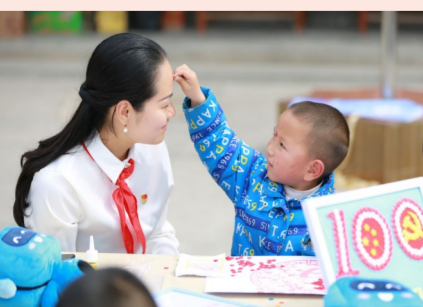
3月8日,中建八局二公司女职工到新乡福利院开展儿童关爱活动,与孩子们携手创作“建党百年”纽扣画。(王光晨)