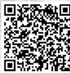
扫描二维码观看 宣讲会直播回顾

继北京首场宣讲后,10名讲述者,连续6天,奔赴全国6省市,走进北京小瓦窑产业园项目、深圳中海地产、上海交通银行新同城数据中心项目、东北区域总部、西安地铁八号线1标段项目、西南区域总部、武汉中国建筑科技馆开展七场巡回宣讲。30余企业代表1700名员工代表在现场聆听宣讲。中央广播电视台总台央视国际频道“时代楷模发布厅”“央视新闻+”“长江云”全程直播,累计超100万“云监工”云端观看。宣讲会深入学习贯彻习近平总书记关于疫情防控工作的重要讲话和党的十九届五中全会精神,认真贯彻落实中央企业抗击新冠肺炎疫情表彰大会暨先进事迹报告会精神,弘扬伟大抗疫精神,为中建集团实现“一创五强”战略目标凝聚团结奋进力量,为开启全面建设社会主义现代化国家新征程作出新的更大贡献。