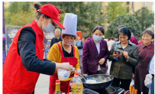
近日,中建五局物业公司开展“邻里文化节”活动。社区居民组织文艺汇演,开展厨艺大赛,进一步拉近邻里关系。(邱晓伟、陈莹)