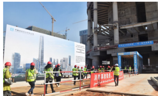
近日,埃及新行政首都CBD项目举行第二次高校交流日活动,艾因夏姆斯大学建筑工程学院25名大学生来到标志塔项目参观交流,近距离了解中国建筑工艺。(鞠众、汤凌)