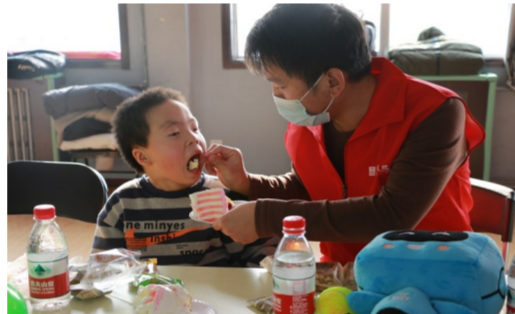
12月6日,中建二局地产公司志愿者来到北京启智智障儿童教育培训中心,与孩子们一起游戏互动,并捐赠生活物资。(周玉鑫)