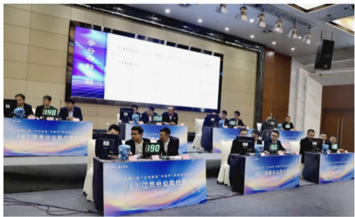
近日,中建一局一公司举办“2020年卓越杯首届质量知识竞赛”,来自7家分公司的21名质量能手,同台竞技尽显技能风采。(马孟婷)

中建一局二公司坚持扶贫与扶志、扶智相结合,强化对贫困人口的精神塑造,近年来通过教育扶贫捐款捐物价值近百万元,为定点扶贫地区贡献力量。(李想)