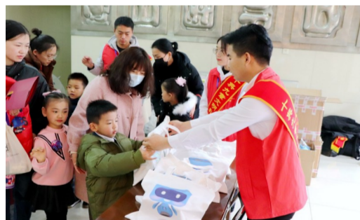
近日,中建七局一公司助力共青团中央“童颂中华·寄语未来”活动,帮助参赛选手及家长测温、搬运活动物资,并送上蓝宝纪念品,累计服务200余人。(安泓鑫、贾珍珍)