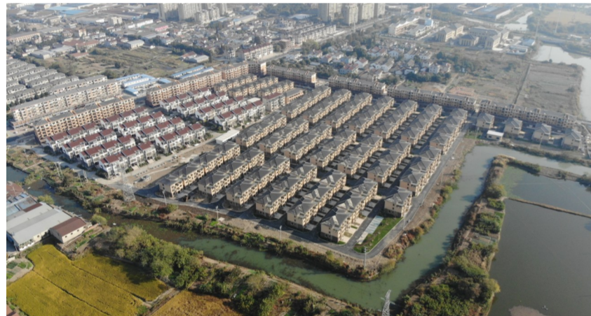
近日,中建国际投资(浙江)有限公司投资建设的浙江旧馆镇木艺小镇PPP项目工程全部完工。(钟海)

中建集团各部门、各单位将继续推进改革落实,明确目标、全力以赴,切实增强国有经济竞争力、创新力、控制力、影响力、抗风险能力,确保全面完成改革任务,为集团高质量发展提供坚强动力。