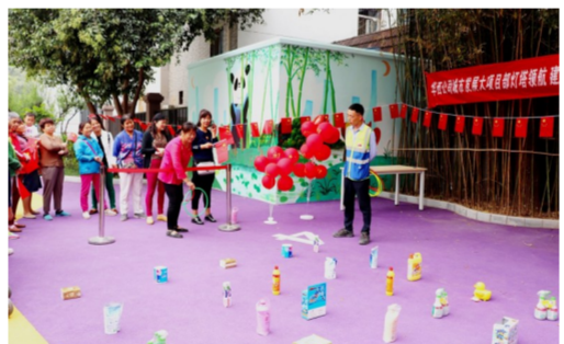
近日,中建安装华西公司雁塔区2019年老旧小区改造项目组织附近居民开展抢帽子、你比我猜等系列趣味活动,增进项目与社区居民群众间的沟通 and 情谊。(符瑞)