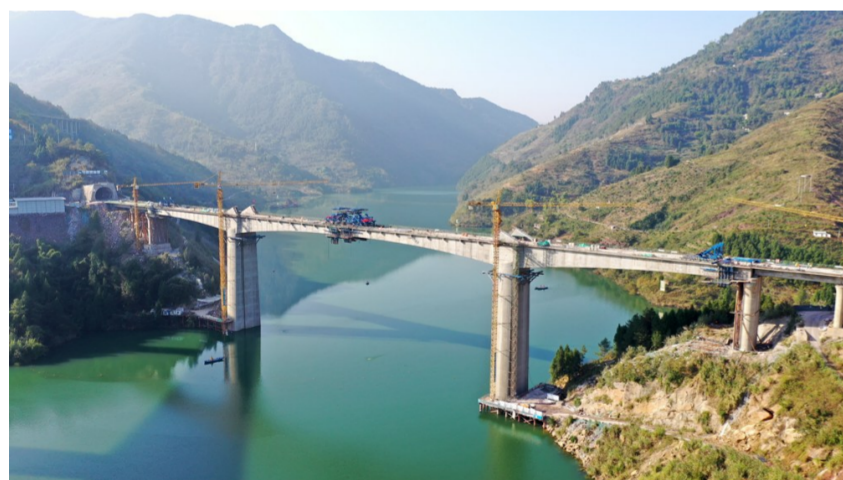
近日,中建五局承建的鄂万高铁全线控制性工程汤溪河大桥顺利合龙,为全线路顺利贯通打下坚实基础。(毛玉芳、杨美玲)