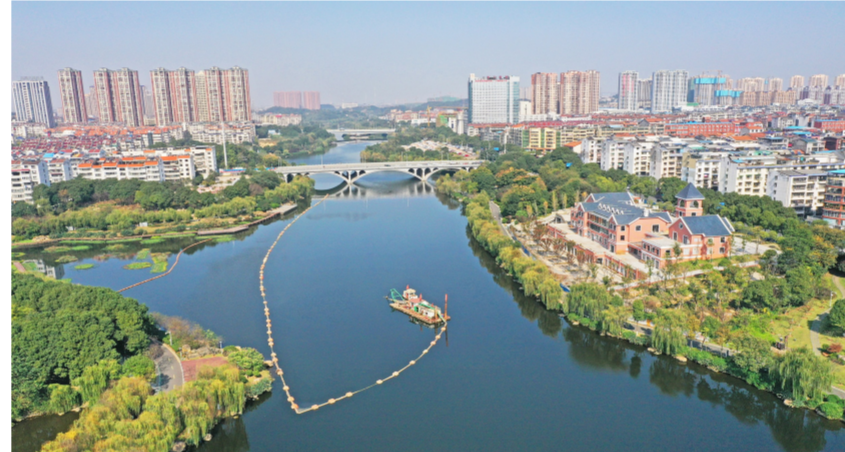
近日,中建二局西南公司承建的湖南岳阳市中心城区污水系统综合治理一期PPP项目子项目王家河水环境综合治理项目清淤全部完成。(樊艳萍)