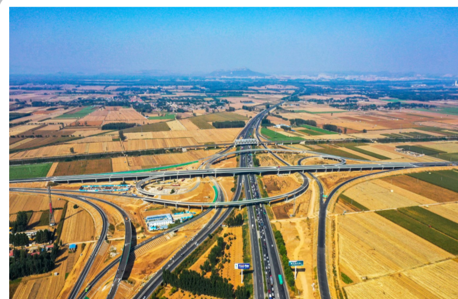
10月31日,由中建八局参与投资、建设的董梁高速公路宁梁段全线正式通车...