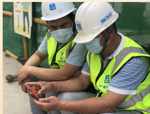
中建二局华东公司武汉雅居乐项目组织员工和工友第一时间收看全国两会直播。(刘艳玲)