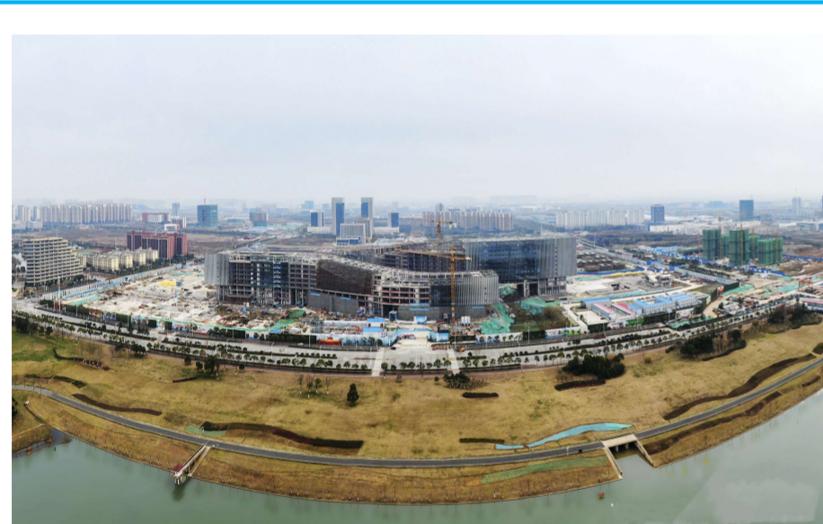
近日，中建八局承建的中科院量子信息与量子科技创新研究院项目进入二次结构以及幕墙施工阶段，项目建成后将成为全球最大的量子信息实验室。（赵晴晴、冯浩）

目前项目65个子项已完成验收43个，其中生态景观工程已完成新建小游园7座，桥梁和公园亮化4处，景观绿化提升6处，治理淦河岸线14.2万平方米。