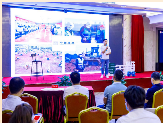
中建四局地产公司开展全国两会主题演讲沙龙,热议中建青年如何在国家高质量发展中发挥作用。(欧阳琨玥)