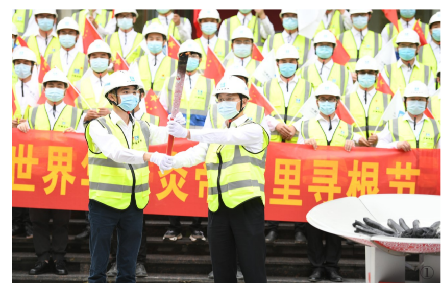
①5月18日,世界华人炎帝故里寻根节上,中建三局建设者在火神山医院前点燃火炬,用实际行动弘扬炎帝精神,将中华民族的顽强拼搏和抗争精神,融入抗击疫情的实际行动,展现中华儿女的铮铮铁骨!