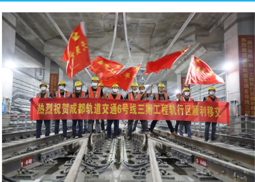
5月27日，中建三局成都轨道交通6号线三期工程提前完成全线运行区移交，标志着该工程全面转入列车调试阶段。（雷晶）