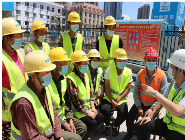
中建六局天津市中心妇产医院扩建项目党支部组织农民工深入学习习近平总书记在全国两会上的重要讲话精神。(六发)