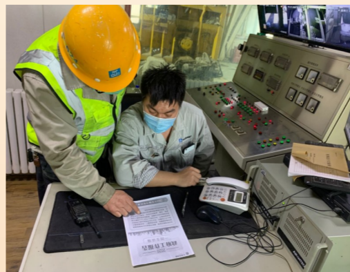
中建西部建设乌鲁木齐预拌厂为一线员工送上纸质版全国两会精神学习材料。(靳梦茹)