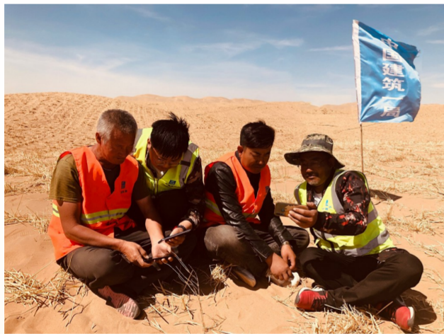
在中建一局三公司乌梁素海流域山水林田湖草生态保护修复试点工程现场,劳务工人老张与工友在工作间隙学习全国两会精神。(韩小琴)

为助力决战决胜脱贫攻坚,中建八局坚持扶贫同扶志扶智相结合,因人施策实施实训基地培训、网络远程教育等农民工建筑技能培训,为提升农民工的技能素质和打造产业工人队伍架起了“立交桥”,培养了一批掌握现代科技知识和劳动技能的新型产业工人队伍,提升了农民工的获得感、幸福感和安全感。(张夏青)