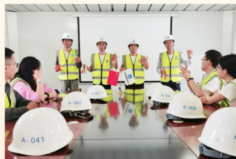
中建长江青年员工打快板、说两会,宣讲全国两会精神。(申明英)