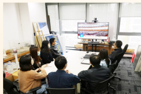
中建东北院原创中心员工集中观看全国两会开幕式,并结合自身岗位热议两会精神。(祁晓峰)