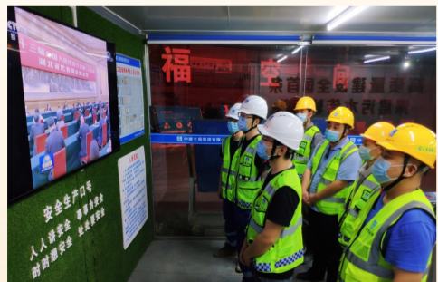
中建三局武汉东湖深隧项目组织员工观看习近平总书记参加湖北代表团审议的电视新闻。(周旭)